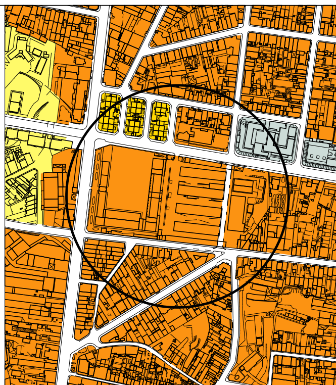
Proposta de alteração (Fevereiro 2019)